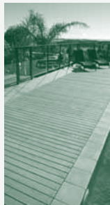
Decking Lame de terrasse Terrassendielen

DE: Die Verda Outdoor Serie setzt sich aus verschiedenen Produkten zusammen, die für den Außenbereich konzipiert wurden. Alle Produkte der Serie weisen die selben Eigenschaften auf und sind perfekt aufeinander abgestimmt um Ihren Außenbereich harmonisch, gemütlich und langlebig zu gestalten.