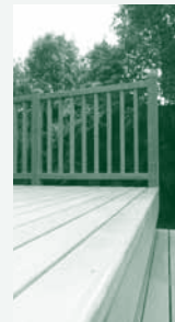
Balustrade Balustrade Balustraden