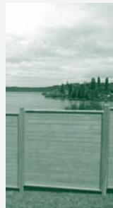
Fence Panel Panneau Zaunelemente