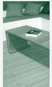
Furniture Mobilier Möbel