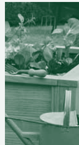
Garden Jardinière Hochbeete